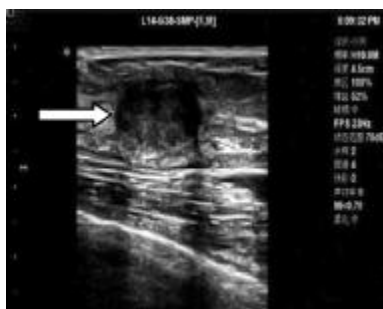
图 1 右乳外上象限肿块 17 mm Fig. 1 Breast tumor 17 mm

术后并发症: 80 个肿块旋切术后出现局部积血 4 个, 占 5%, 即刻抽吸残腔内积血, 用弹力绷带加压包扎后未出现明显血肿, 无明显疼痛不适, 未发生感染及其他并发症.