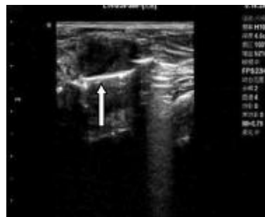
图 2 超声引导下旋切刀置入肿块后方 Fig. 2 Ultrasound-guided Encor system