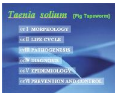
图 3 完成的课件截图