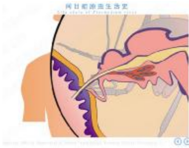
图 2 生活史 Flash 动画截图